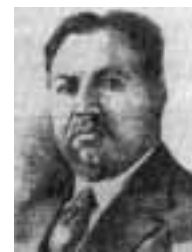
شاعر آزادیخواه؛ فرخی یزدی