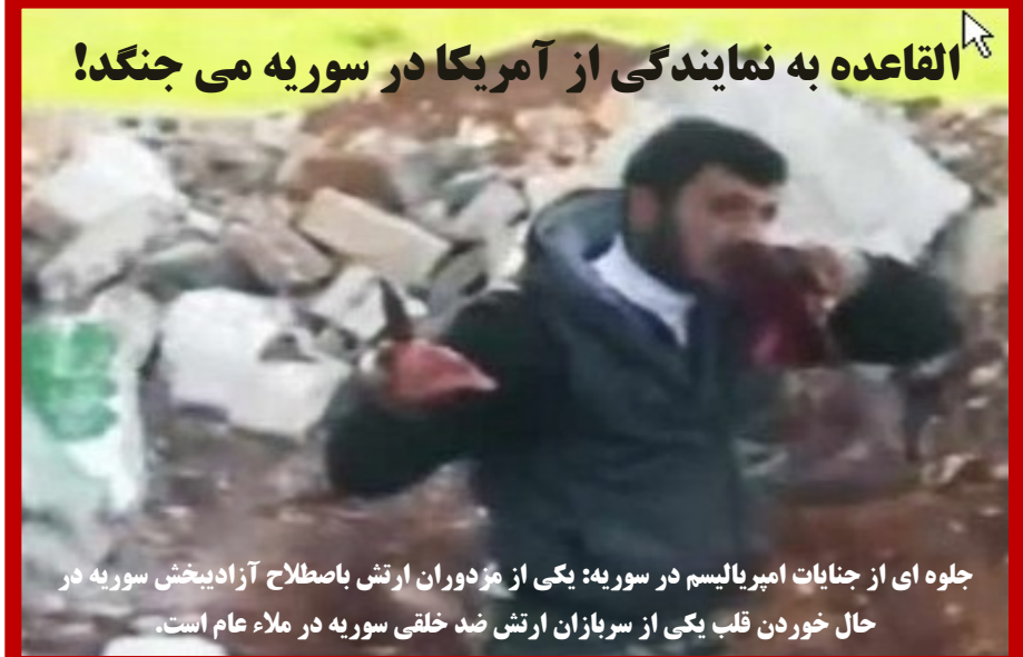
جلوه ای از جنایات امپریالیسم در سوریه؛ یکی از مزدوران ارتش باصطلاح آزادیبخش سوریه در حال خوردن قلب یکی از سربازان ارتش ضد خلقی سوریه در ملاء عام است.

یک طرف این جنگ ضد مردمی رژیم سرکوبگر و ددمنش بشار اسد حافظ نظام سرمایه داری حاکم در سوریه می باشد که سالهاست در خدمت امپریالیست های غرب و شرق، تسمه از گردنه مردم رنجیده این کشور کشیده و امروز تحت حمایت امپریالیسم روسیه این جنگ را پیش می برد، و طرف دیگر گروه های مزدوری هستند که با پول و اسلحه قدرتهای امپریالیستی غرب (آمریکا و اتحادیه اروپا) در جهت پیشبرد سیاستهای این قدرتها در سوریه، سازمان یافته و به نام "شورای ملی سوریه" و به مثابه نماینده مردم و "انقلاب" سوریه از سوی قدرتهای امپریالیستی غرب و رسانه های وابسته به آنها به افکار عمومی معرفی می شوند.