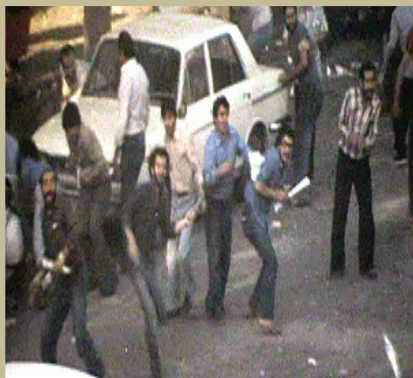
مقاومت توده ها در برابر یورش ارتجاع