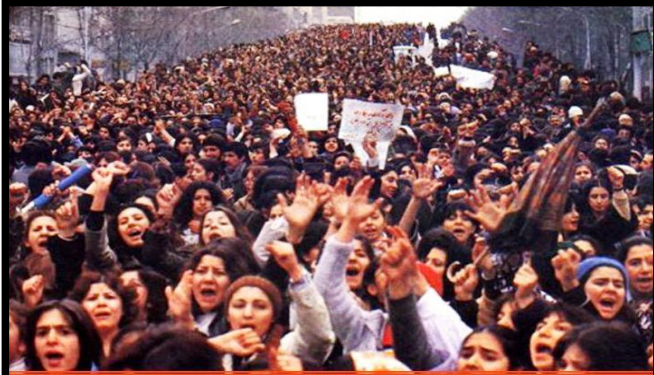
International Women's day demonstrators Tehran, March 8, 1979

مبارزه با همه فرهنگ های مردسالارانه، مبارزه برای نابودی جمهوری اسلامی، رژیمی که تو ۳۰ سال گذشته نشان داده که همه جناح های درونی اش مروج و حامی این فرهنگ زن ستیز و