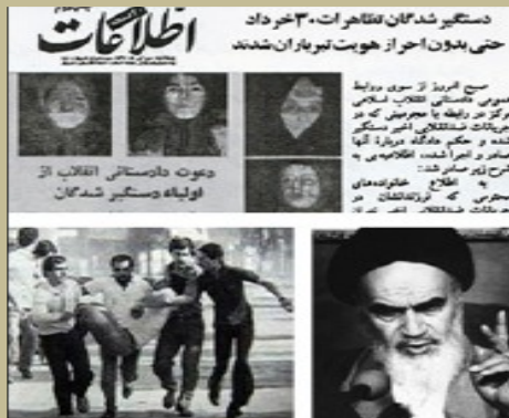
اعلام اعدام های دسته جمعی جوانان در روزنامه های رژیم