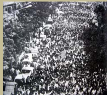
تظاهرات نیم میلیون نفری در تهران بر علیه رژیم جمهوری اسلامی

جاودان باد خاطره تمامی شهدای بخون خفته خلق!