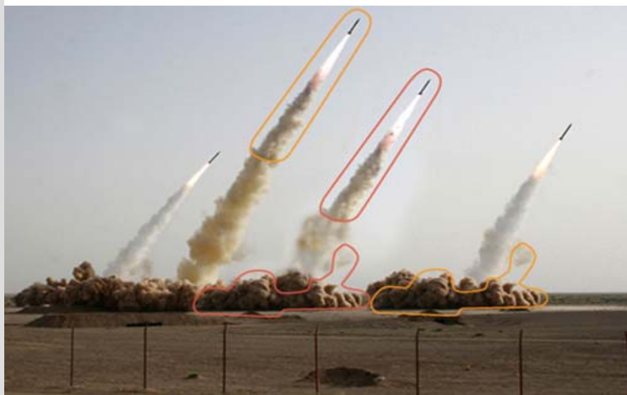
آژانس خبری فرانس پرس با انتشار تصویر "مانور موشکی" جمهوری اسلامی معتقد است که رژیم این عکس را با استفاده از تکنیک دیجیتالی "بازسازی" کرده است!

زیر سوال بردند. حتی وزیر خارجه روسیه با توجه به همین واقعیت اعلام نمود که "این مانور نشان داد که خطری از سوی ایران غرب را تهدید نمی کند." و روزنامه "گلف نیوز" گزارشات جمهوری اسلامی از این مانور را با "بلوف های رژیم صدام" قبل از حمله امریکا به این کشور مبنی بر داشتن "زرادخانه های موشکی و یک ارتش یک میلیونی" مقایسه نمود! رسوائی رژیم در رابطه با مانور اخیر وقتی بیشتر بالا گرفت که برخی از خبرگزاریها و مطبوعات جهان گزارش دادند که سپاه پاسداران جمهوری اسلامی جهت بزرگ نمائی قدرت موشکی رژیم با دستکاری فیلم هائی که از این "رزمایش" تهیه شده بود فیلمی جعلی و دستکاری شده در اختیار آنها قرار داده است و حتی نشریه نیویورک تایمز ضمن مسخره کردن جمهوری اسلامی نوشت که در این رژیم "استعداد خوبی برای جعل موشکی و استفاده از برنامه کامپیوتری «فتو شاپ» وجود دارد". اما وزیر خارجه اریکا با نمایش یک بی اعتنائی آشکار به همه رسوائی های جمهوری اسلامی در مانور اخیر، ضمن جدی جلوه دادن بلوف های سردمداران جمهوری اسلامی، با استفاده از فرصتی که چنین مانور هائی در اختیارش قرار داد، اعلام نمود که امریکا به هیچکس "اجازه" نمی دهد که به متحدینش در منطقه آسیبی برساند.