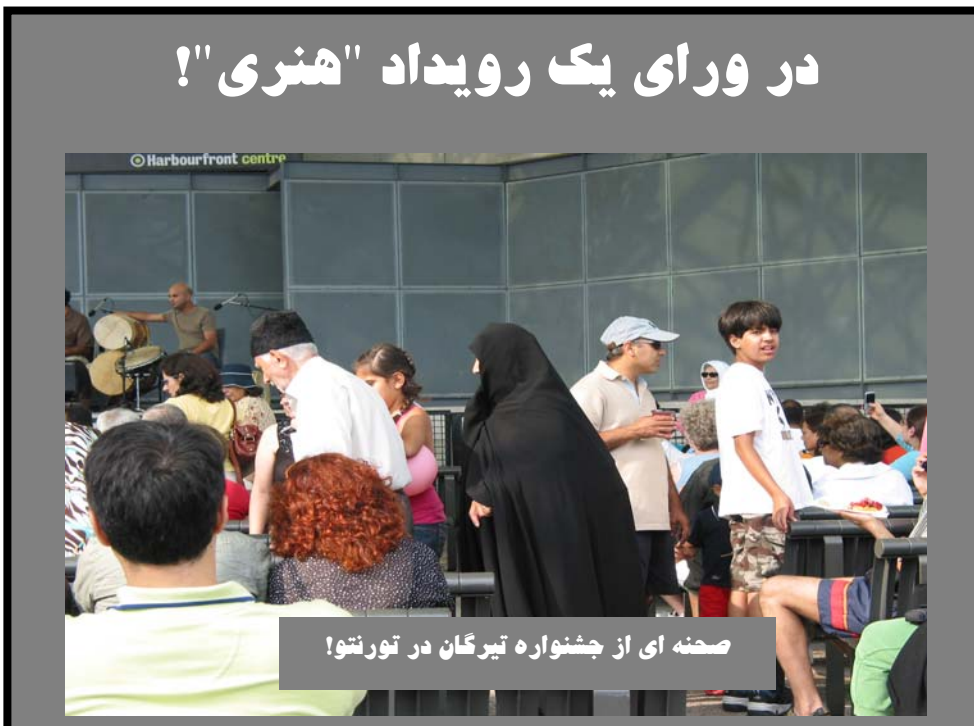
صحنه ای از جشنواره تیرگان در تورنتو!

مقابل شعارهای همیشگی مزدوران رژیم مبنی بر "مهدی بیا! مهدی بیا!" ( سر بدهند! پس از این واقعه آنها دم خود را روی کولشان گذارده و پا به فرار گذاشتند و در آن روز به همان سوراخهای خود یعنی "پشت صحنه" جشنواره یکی بود یکی نبود خزیدند!