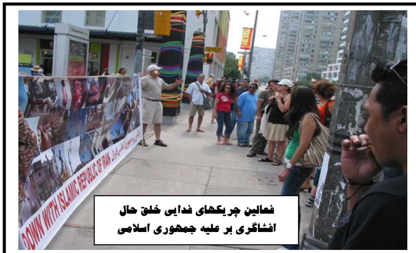
نماین چریکهای فدایی خلق حال افشاگری بر علیه جمهوری اسلامی

امروز با شروع برنامه های جشنواره در ساعت ۶ عصر، ما نیز کار افشاگری علیه جمهوری اسلامی را در محل برنامه آغاز کردیم. به محض رسیدن به آنجا با تذکرات گارد "هاربور فرانت سنتر" روبرو شدیم که به بهانه های مختلف مثل جلوگیری از سد معبر، تلاش داشتند که کار ما را متوقف کنند. با پرس و جو از خود آنان متوجه شدیم که آنها از جانب برگزارکنندگان تحت فشار قرار گرفته اند.