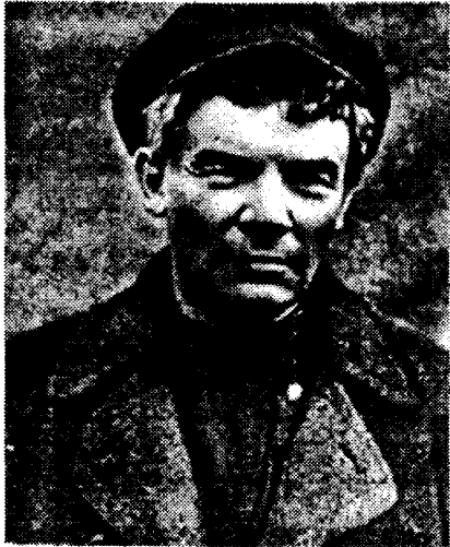
ولادیمیر ایلیچ اولیانوف لنین

روز ۲۵ اکتبر اگر برای نیروهای چپ روزی برامید و با فعالیتی پر جنب و جوش بود برای نیروهای طرفدای رژیم کهن چنین نبود... خلیج فنلاند، دورادور کرونشانت و پتروگراد این هنگام چه منظره ای داشت؟ این منظره را آهنگی که در آن زمان ورد زبانها بود به نیکی می نمایاند ( این شعر به ملودی فولکلور استنکای رازین خوانده می شد) از جزیره کرونشانت تا رودخانه پهناور نوا قایقهای پرشماری، بلشویک ها را بر عرشه دارند و امواج را در می نوردند... در این هنگامه تحولاتی پراهمیت در اسمولنی روی می داد. در حالیکه تالار بزرگ و اصلح ساختمان تا نزدیک طاقهایش انباشته از نمایندگان شوراهای پتروگراد و شوراهای ولایتی بود... تروتسکی نشست اضطراری شورای پتروگراد را در ساعت دو سی و پنج دقیقه بعد از ظهر ۲۵ اکتبر آغاز کرد... میان سخنرانی تروتسکی، لنین در سالن ظاهر شد. جمعیت که چشمش به او افتاد از جا بلند شد و کف زدن و هلهله توفان آسایی را آغاز کرد... لنین از ورای ظنن صداها اعلام داشت: 'رفقا! انقلاب کارگران و دهقانان که بلشویک ها آن همه از لزوم آن سخن گفته اند اکنون تحقق یافته است، اهمیت این انقلاب کارگران و دهقانان چیست؟ نخستین اهمیت این انقلاب آن است که ما حکومتی شورایی خواهیم داشت که بازوی قدرت خودمان، بدون شرکت بورژوازی است. توده های ستم کشیده حکومت خودشان را