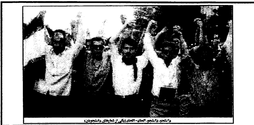
دانشجویان در حال شعار دادن - تهران - آذرماه ۱۳۵۷

به این ترتیب جنبش دانشجویی نیز مانند سایر جنبشهای درون جامعه تحت تاثیر فضای سرکوب و اختناق هیات حاکمه قرار گرفت و بتدریج از وسعت و دامنه عمل آن کاسته شد. رژیم سرکوبگر جمهوری اسلامی با کاربرد این تمهیدات کوشید تا جنبش دانشجویی را برای همیشه سرکوب کرده و آن را تحت کنترل خویش درآورد و پتانسیل مبارزاتی درون دانشگاهها را مضمحل سازد. اما به رغم این آمل و آرزوها حتی در سیاهترین دروان اختناق، دانشگاهها از صدای اعتراض و طغیانهای مبارزاتی کوچک و بزرگ دانشجویی که هربار وحشیانه تر سرکوب می شد، تهی نگشت .