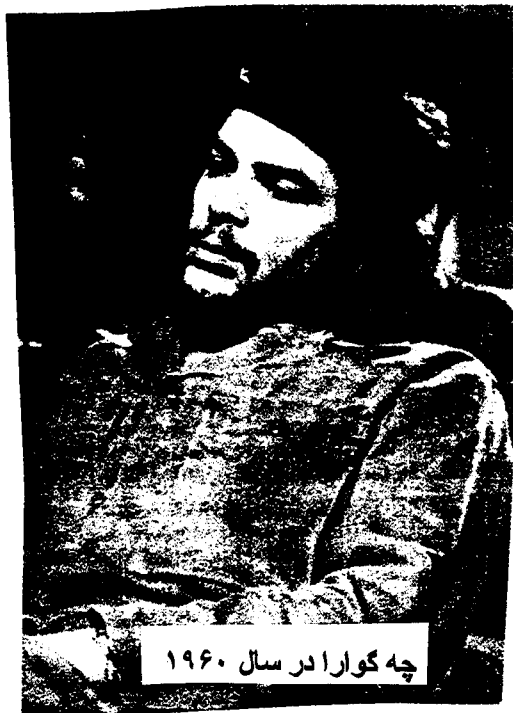
چه گوارا در سال ۱۹۶۰

زنده باد مبارزه مسلحانه که تنها راه رسیدن به آزادی است!