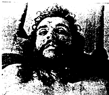
جسد تیرباران شده چه گوارا

سی سال پس از شهادت ارنستو چه گوارا توسط امپریالیسم و مزدورانش در بولیوی، اندیشه های سترگ این انقلابی کبیر همچنان برافروزنده مشعل انقلاب و آزادی در دل میلیونها تن از کارگران و زحمتکشان و خلقهای ستمیدیده سراسر جهان است. "چه"، مظهر یک انقلابی سرسخت و آشتی ناپذیر و کمونیست پایداری بود که با ایمانی خلل ناپذیر به انقلاب و سوسیالیسم، تا آخرین لحظه زندگی پرافتخارش با امپریالیسم و ارتجاع جنگید و درفش آزادی و عدالت اجتماعی را در اهتزاز نگاهداشت!