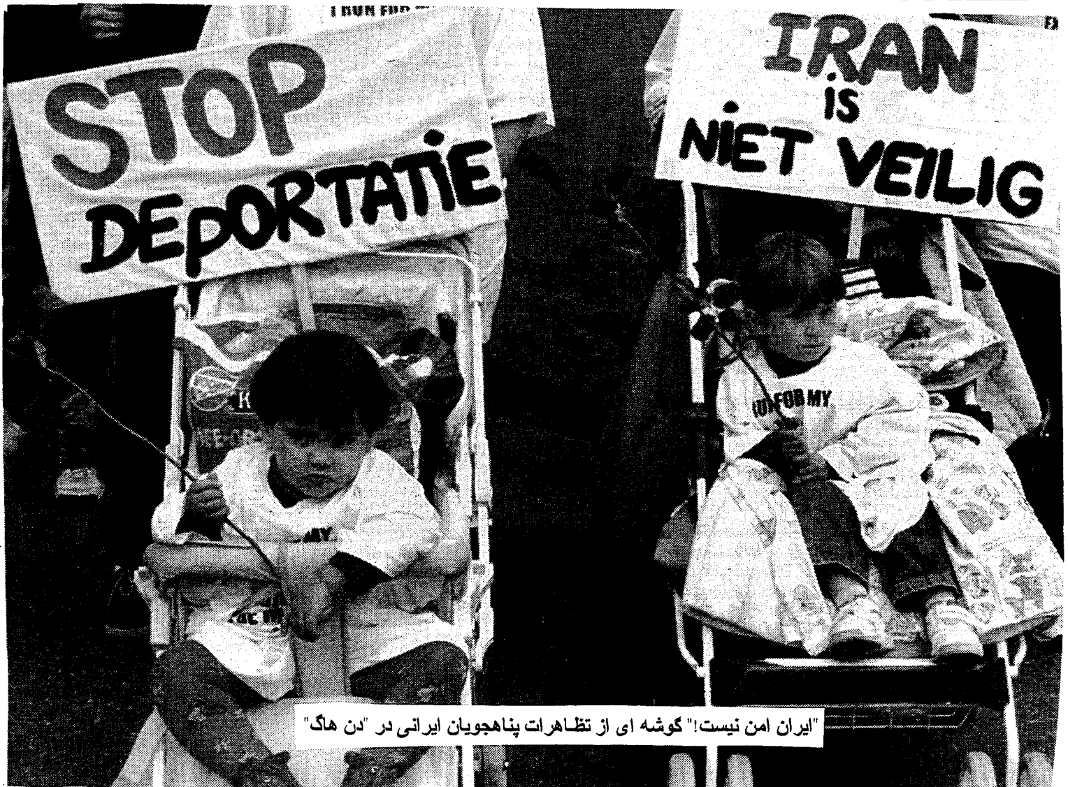
"ایران امن نیست!" گوشه ای از تظاهرات پناهجویان ایرانی در "دن هاگ"