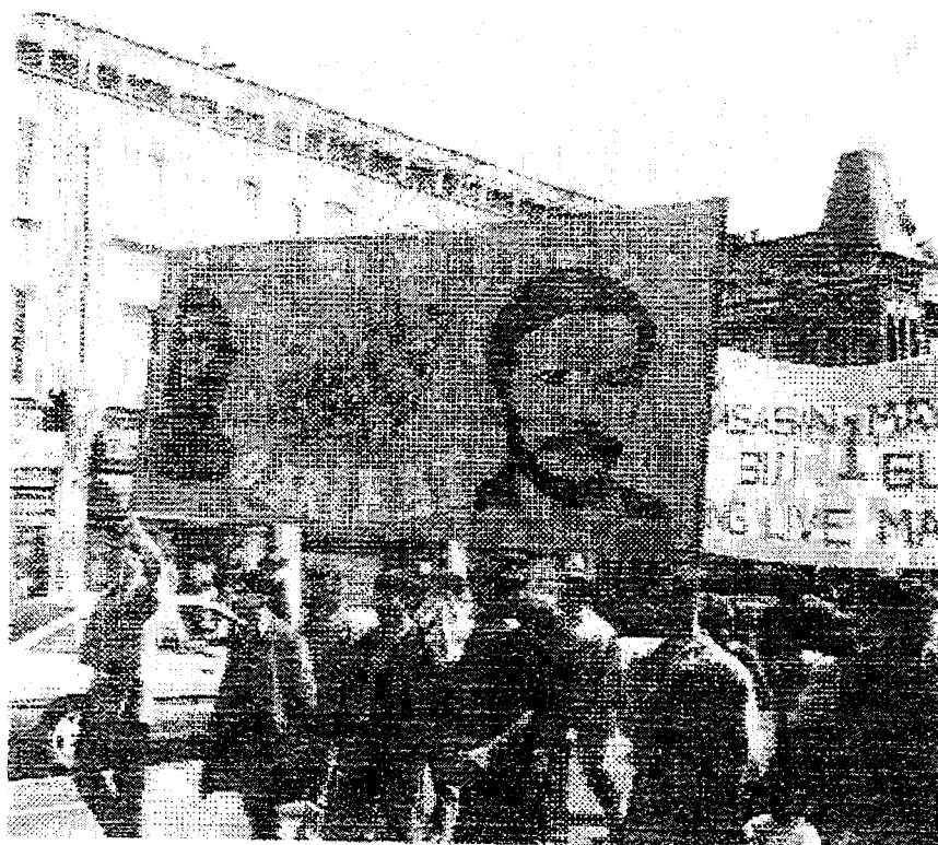
گوشه ای از تظاهرات روز جهانی کارگر (اول ماه مه ۱۹۹۲) در انگلیس

در آغاز سمینار متن کوتاهی به خاطره تمامی شهدای به خون خفته خلق قرائت و در بزرگداشت یاد آنان یک دقیقه سکوت اعلام شد. پس از آن متن کوتاهی از سوی برگزارکنندگان سمینار در بزرگداشت اول ماه