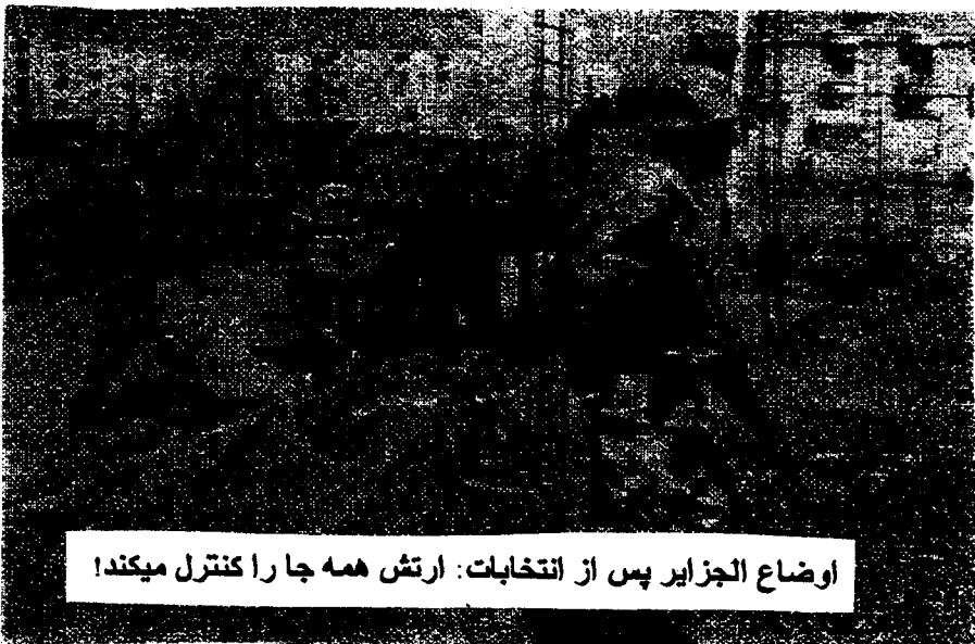
اوضاع الجزایر پس از انتخابات: ارتش همه جا را کنترل میکند!

عملیات اشغال سفارت پرو در دانمارک به یاد یکی از جوانترین زن اعضای گروه که توسط سربازان پرویی دستگیر و وحشیانه اعدام گشت "Mariene" نامگذاری شده بود. اشغال سفارت رژیم دیکتاتور پرو در کپنهاگ توجه افکار عمومی را به جنایت وحشیانه دولت پرو در کشتار ۱۴ انقلابی پرویی جلب کرده و چهره کتیف حاکمیت "فوجی سوری" جلاد را هرچه بیشتر افشا نمود.