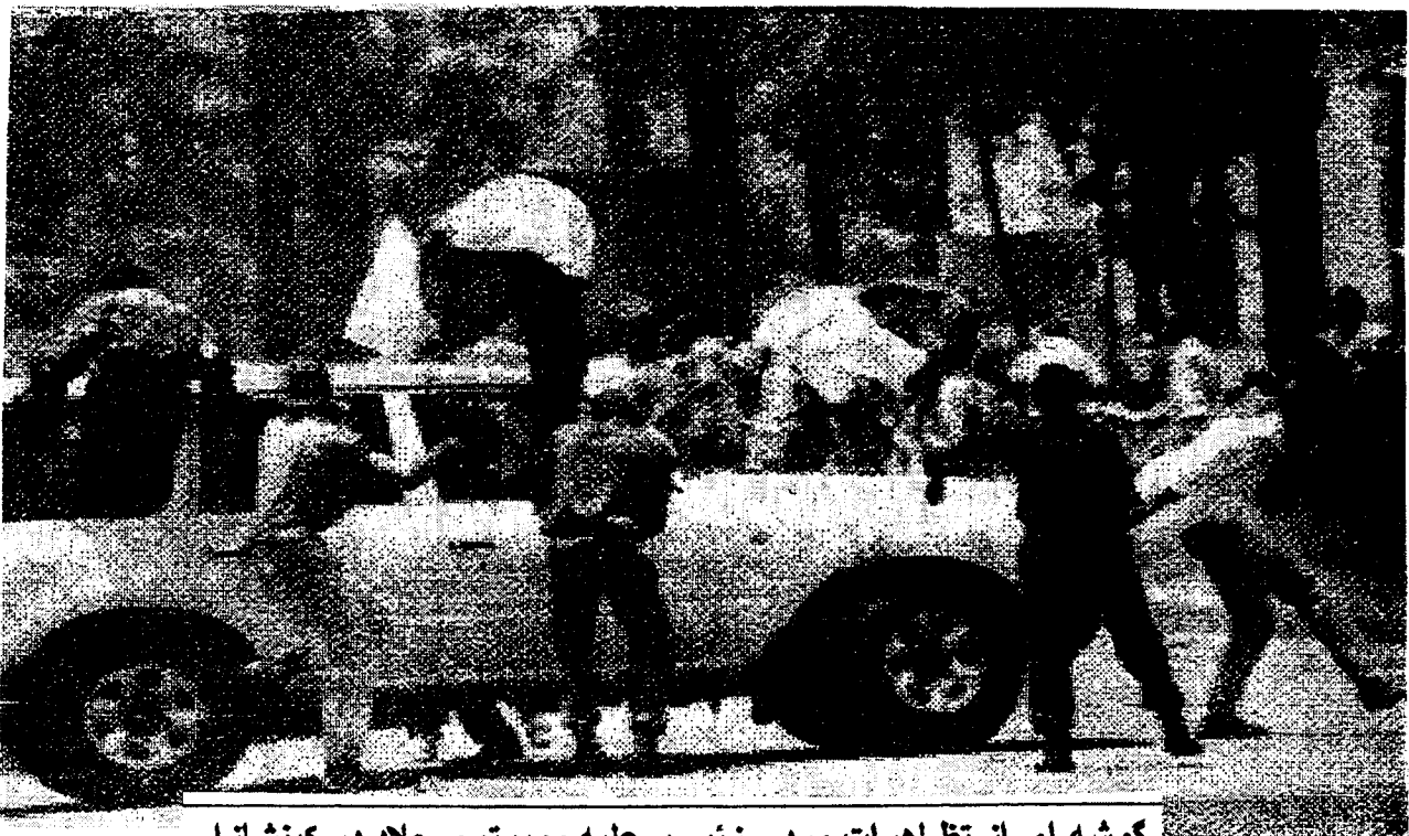
گوشه ای از تظاهرات مردم زئیر بر علیه موبوتوی جلال در کینشازا

در خاتمه آنچه که در تحولات اخیر زئیر باید بر آن تاکید گردد عبارت از این واقعیت است که درست است که با سقوط موبوتو، این جلال خلقهای تحت ستم زئیر و روی کار آمدن "جبهه دمکراتیک" کابایلا، توده های محروم زئیر به "آشتی ملی" و دمکراسی و در یک کلام به آزادی دست نیافته اند. مدارسهای ناشی از این وقایع بدون شک دیریا زود فصل جدیدی از مقاومت و تشدید مبارزه بر علیه امپریالیسم و سگان زنجیرش در این کشور را خواهد گشود.